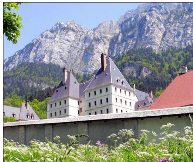
Les fidèles arriveront dimanche matin au monastère et partageront une messe avec les pères chartreux.

CHARTREUSE | Pèlerinage ce week-end Ils vont monter à pied au monastère