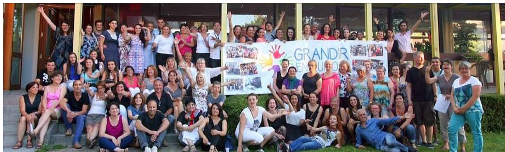
La délégation européenne du projet "Grandir en Europe" est repartie hier soir après dix jours denses de découvertes des politiques sociales et familiales françaises.

ISÈRE | Dix jours de travail intense pour la délégation européenne du projet petite enfance "Grandir en Europe" L'envie d'aller encore plus loin